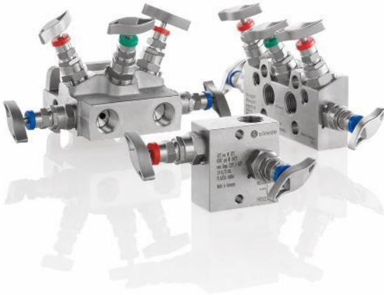
Bild 1: AS-Schneider zeigt auf der ACHEMA Pulse 2021 ein Produktportfolio, das schon jetzt die Anforderungen der neuen TA-Luft erfüllt.